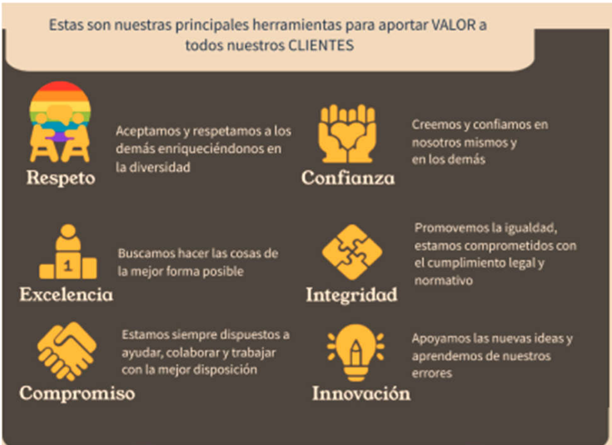
Figura 1. Valores que nos identifican